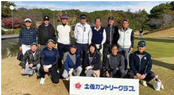
風がビュービュー強い中、土佐CCで開催されました