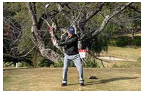
新谷会員は土佐CCデビューでした