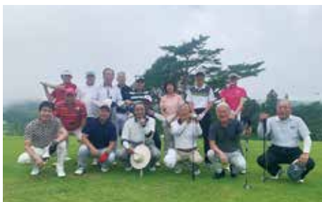
悪天候を吹っ飛ばす素敵な笑顔