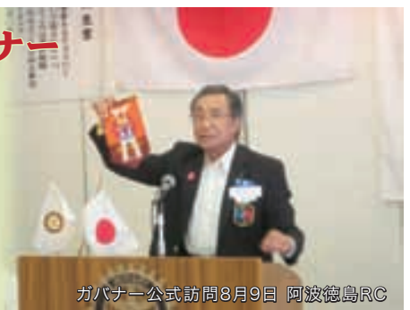
ガバナー公式訪問8月9日 阿波徳島RC