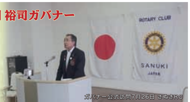
ガバナー公式訪問7月26日 さぬきRC